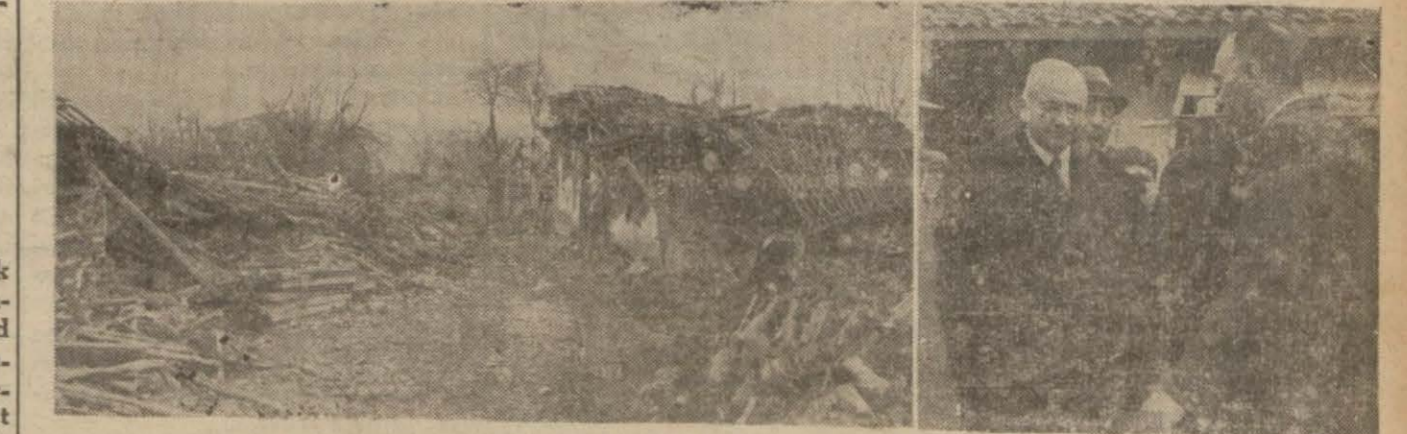
Erbaadan gelen son resimler: Kasabada bir caddenin manzarası ve Sıhhye Vekili tetkikleri esnasında

Tokad 29 (A.A.) — Vilâyetimiz merkezinde yer sarstıtısı felâketzedeleri için yapılan para bağışları Kızılay Kurumu umumi merkezine gönderilmiştir. Bundan başka gene buradan temin olunan erzak